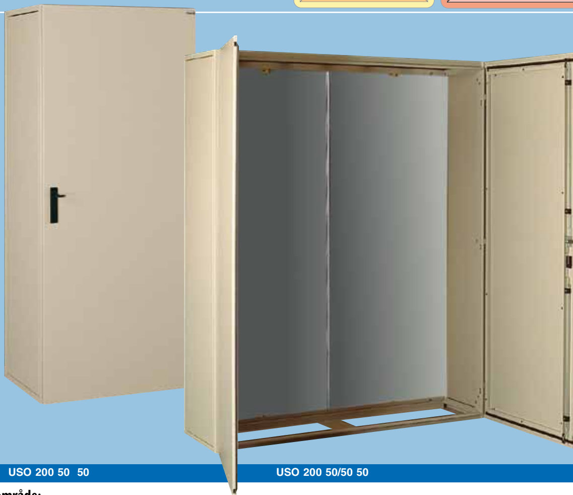
USO 200 50 50