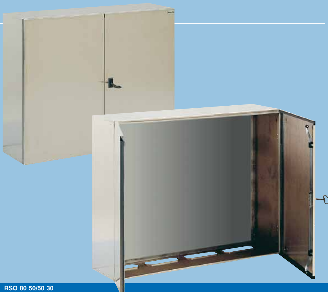
RSO 80 50/50 30