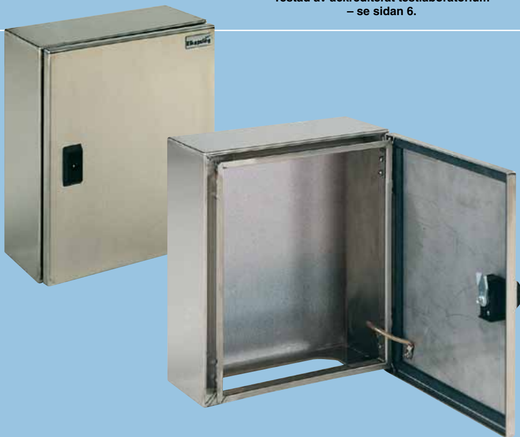
RSE 35 30 15 (Jordflätan är tillbehör.)

Tillverkas även i EMC och UL-utförande. Testad av ackrediterat testlaboratorium – se sidan 6.