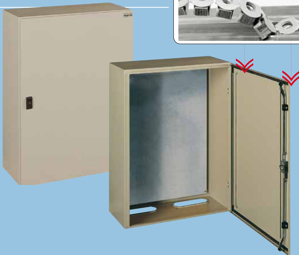
AES 80 60 30