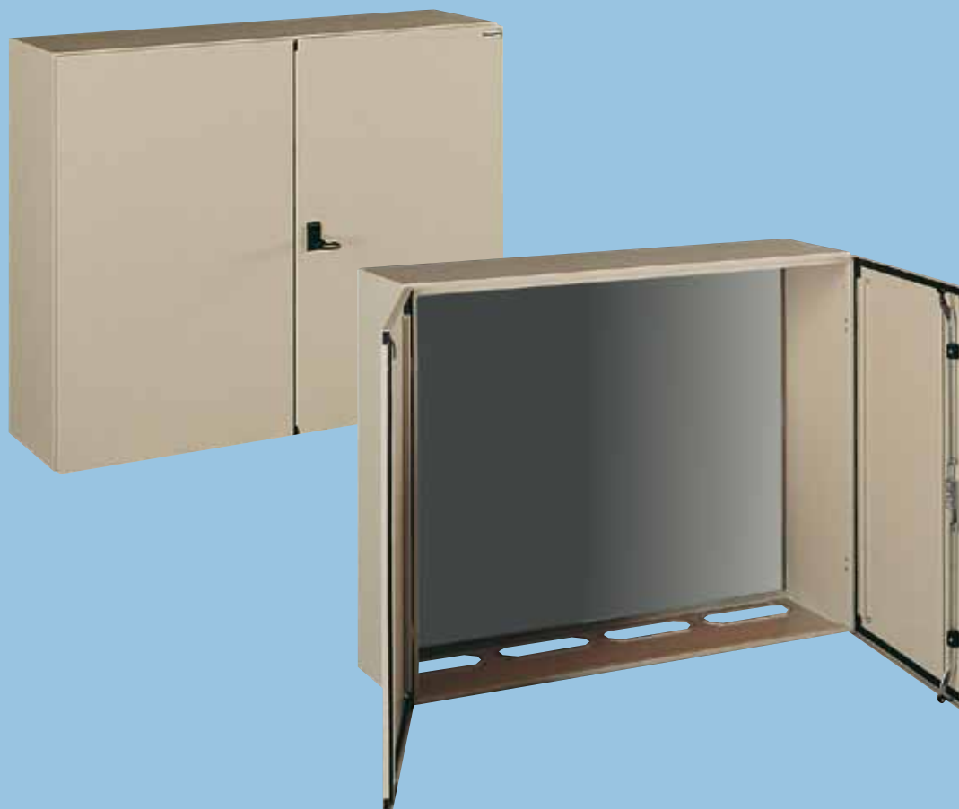
AEO 80 50/50 30