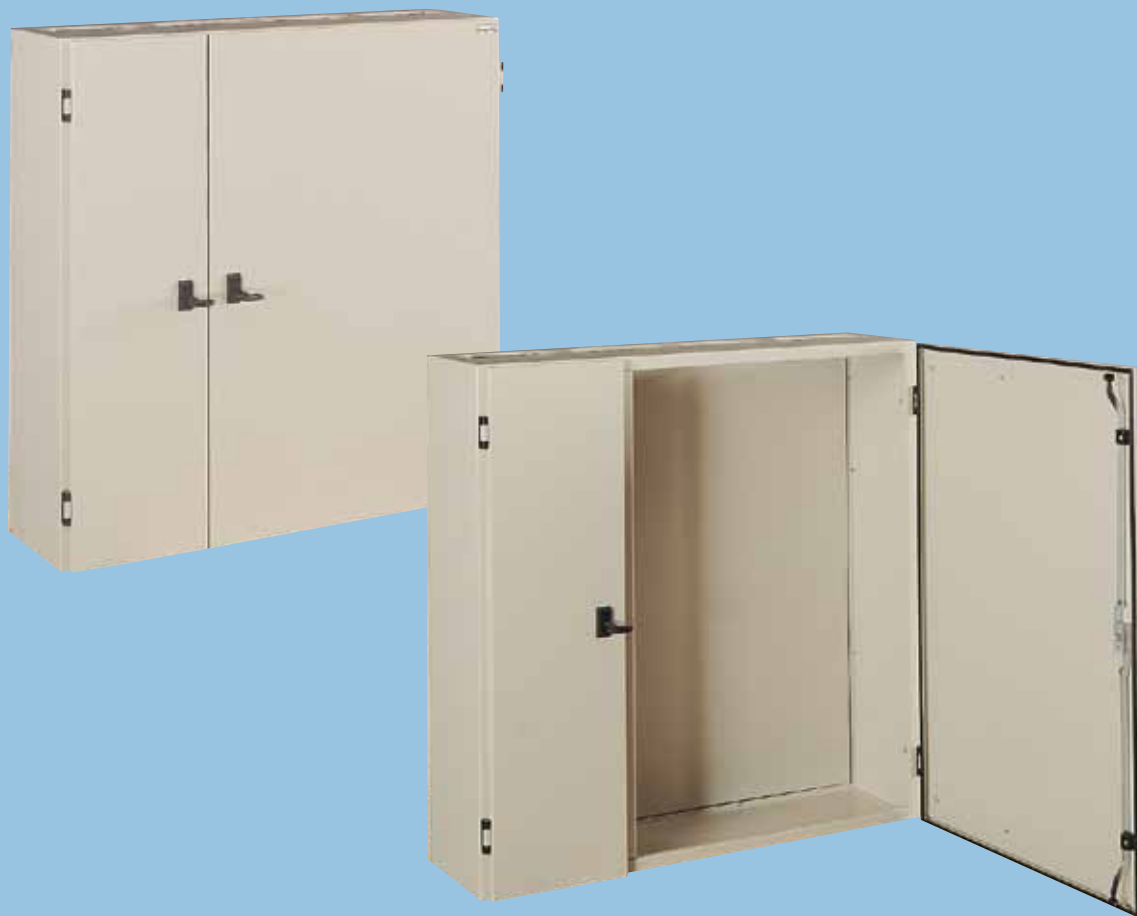
VSD 100 30/70 30